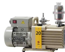
• Vacuum Pump