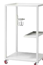
• ST-8 Stand